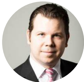
Ralf Artnr Bildungspolitik WKW