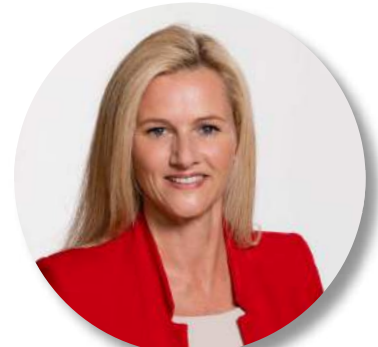
Abg.-NRin Mag.ª Petra Tanzler Bildungssprecherin SPÖ