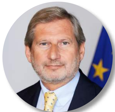
Dr. Johannes Hahn

Co-Chair Ban Ki-Moon-Centre Bundespräsident der Republik Österreich (2004 – 2016)