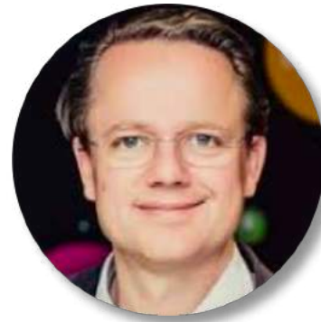
Dir. Philip List Financial Life Park (FLIP)