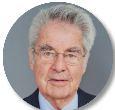
Dr. Heinz Fischer

Präsidentin der AK Wien und der Bundesarbeiterkammer, Mitglied des Bundesrates