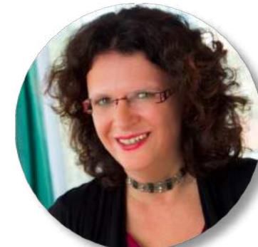
SektChefIn Doris Wagner BEd Med Sektion I (Allgemeinbildung und Berufsbildung) des BMBWF